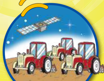
マルチロボットトラクタ