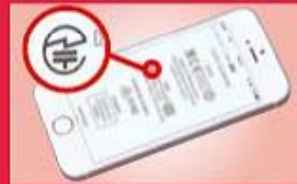
スマートフォン等では、液晶画面に表示される場合もあります