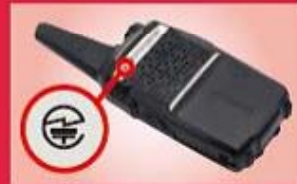
トランシーバー：裏面または内蔵バッテリーを取り外した部分