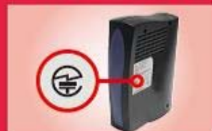
無線LAN 据え置き型の機器：裏面

多くの場合、無線機器の型式名称や製造者が記載された銘板や外箱に表示されています。