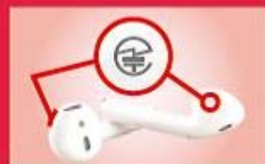
ワイヤレスイヤホン：本体やタグなど