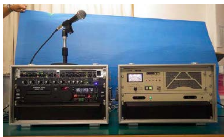
マイク、録音再生機、音声調整機、送信機等