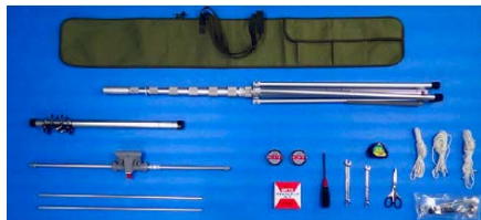
アンテナ・支柱・固定具等