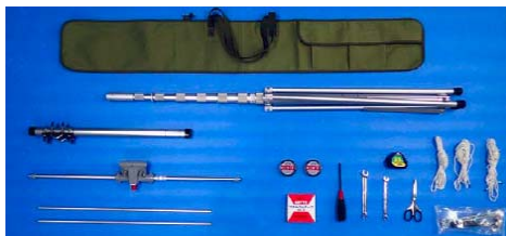
アンテナ・支柱・固定具等