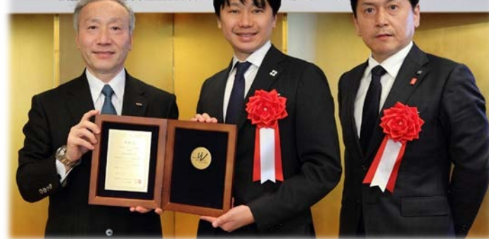
「第19回テレワーク推進賞」の会長賞を受賞(2019/2/21に表彰式)

主催：一般社団法人日本テレワーク協会 後援：総務省/厚生労働省/経済産業省/国土交通省/東京商工振興センター/日本テレワーク協会/フジテレビ 公益財団法人日本生産性本部/日本生産性本部/日本生産性本部/日本生産性本部/日本生産性本部/日本生産性本部/日本生産性本部/日本生産性本部/日本生産性本部/日本生産性本部