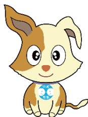
行政相談マスコット 「キクーン」