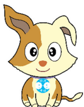
行政相談マスコット キクーン

法務局、熊本国税局、河川国道事務所、年金事務所、宮崎県、県消費生活センター、都城市、弁護士、司法書士、行政相談委員、行政相談センターまくみみ宮崎