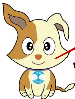
行政相談のマスコット キクーン