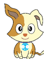
行政相談のマスコット キクーン