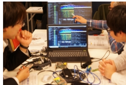
・機材を用いた無線管理実習の様様