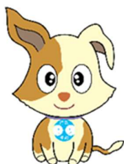
行政相談のマスコット 「キクーン」

行政相談委員は、無報酬のボランティアとして、国民の皆様から、国の行政活動全般に関する苦情や相談を受け付け、相談者への助言や関係機関に対する改善の申入れなどを行っています。