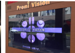
街頭モニター (鹿児島)