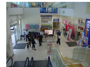
物販店での広報 (岡山)