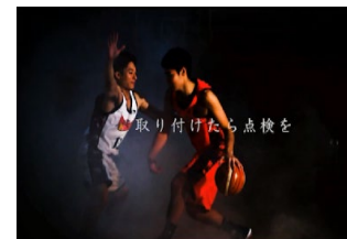
広報用映像を作成 (愛知)