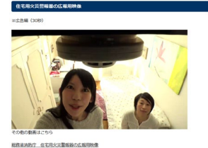
ホームページ (静岡)