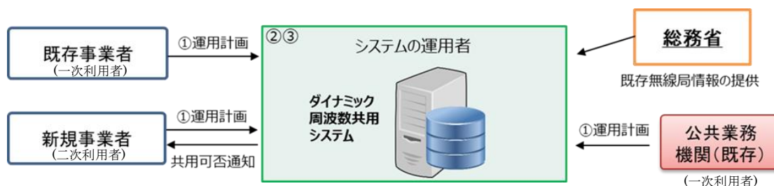
図表 2 ダイナミック周波数共用システムを用いた新たな運用調整の仕組み

このようなダイナミックな周波数共用については、諸外国においても、米国における SAS (Spectrum Access System)、欧州における LSA (Licensed Shared Access) 等の仕組みが導入・検討されている。例えば、米国では、本年9月、FCC (連邦通信委員会) が SAS を提供する民間事業者を認証し、商用展開が開始されたところである。