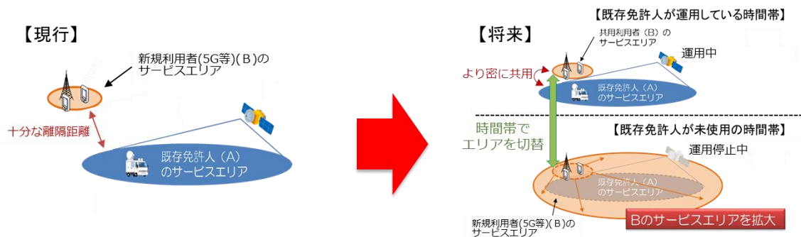
図表 1 ダイナミックな周波数共用のイメージ

こうした異なる無線システム間のより柔軟で動的な(ダイナミックな)周波数共用について、時間的・地理的条件に応じて共用の可否を自動的に判定するためのシステム(ダイナミック周波数共用システム)の開発が進められており、令和元年度当初予算として24.9億円が措置されたところである(図表2参照)。