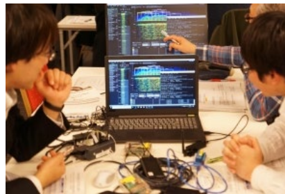
・機材を用いた無線管理実習の様様