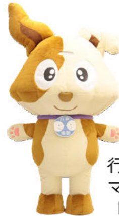
行政相談の マスコット 「キクーン」