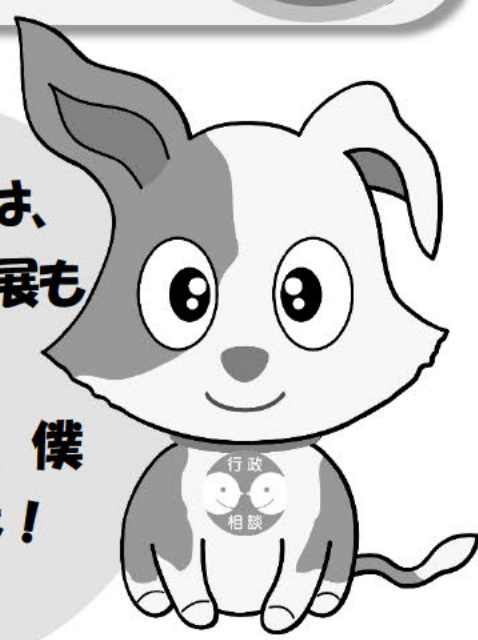
行政相談のマスコット キクーン

11/28～30は、 行政相談パネル展も やってるよ！ 11/30には、僕 も会場に行くよ！