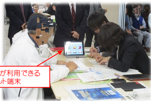
通訳サービスが利用できる タブレット端末