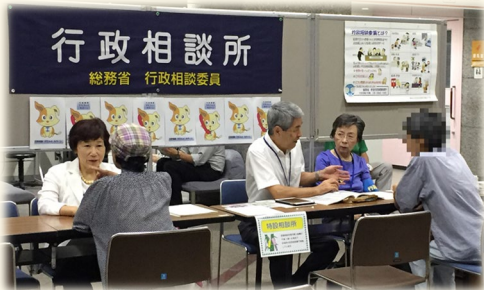
東京都杉並区で行政相談委員が開設する相談所

住民に身近な相談役として、全国に約5,000人(各市区町村に1人以上)が配置され、市・区 役所や町・村役場で定期的に相談所を開設しています。