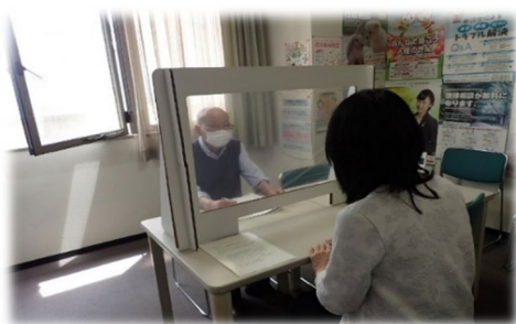
飛沫 まつ 感染防止のため、パーテーションやビニールカーテン等を設置