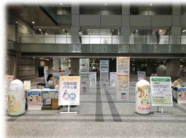
総務省本省でイベントとして開催したパネル展の様相 (R2. 7. 29~31)