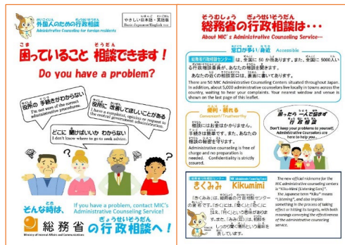
行政相談多言語リーフレット (12か国語にて「やさしい日本語」を併記)