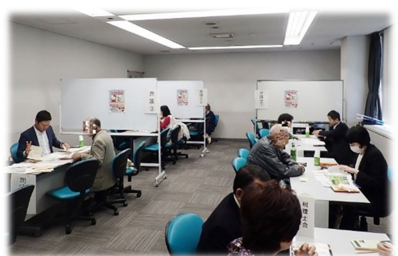
大阪府堺市一日合同行政相談所 (R1. 10. 16)