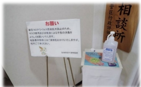
相談所入口にアルコール消毒液を設置して、手指消毒への協力をお願い

コロナ禍の状況を踏まえ、一日合同行政相談所においては、感染防止の取組を徹底し、一部の相談所では、テレビ電話等を活用し、直接対面しない方法での相談にも取り組みます。