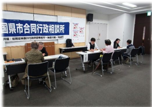
神奈川県相模原市一日合同行政相談所 (R1. 11. 13)