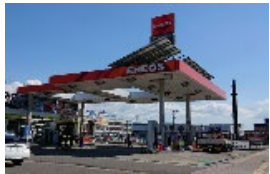
給油取扱所のイメージ