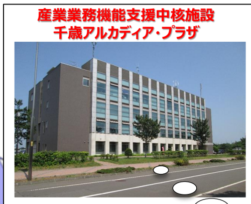
産業業務機能支援中核施設 千歳アルカディア・プラザ