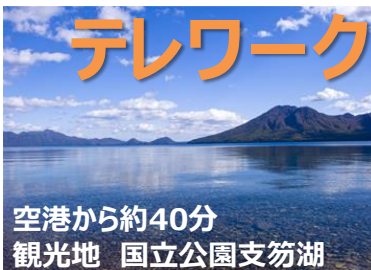
空港から約40分 観光地 国立公園支笏湖