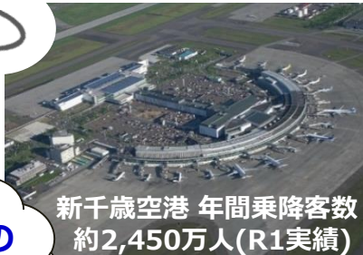
新千歳空港 年間乗降客数 約2,450万人(R1実績)