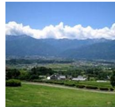
ふたつのアルプス