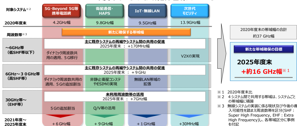
2025 年度末までの帯域確保目標イメージ

携帯電話網システムは、+約 6 GHz 幅を帯域確保の目標とする。候補帯域は、携帯電話網に割当て済みの LTE（～3.5GHz）及び 5G / ローカル 5G（Sub6GHz、ミリ波）に加え、2.3GHz 帯、4.9GHz 帯、26GHz 帯、40GHz 帯などが想定される。