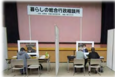
マスク着用、飛まつ防止パネル設置（香川県東かがわ市）