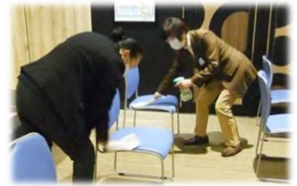
備品の消毒（北海道旭川市）