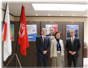
行政相談委員による新潟県知事への表敬訪問（R3.4）