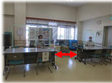
相談ブースの間隔確保（沖縄県沖縄市）