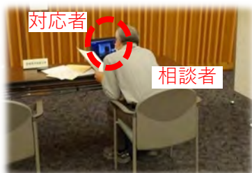
きくみみ愛媛での取組