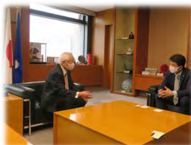
行政相談委員による茨城県知事への表敬訪問（R3.5）