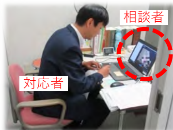
きくみみ兵庫での取組