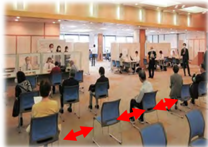
待合所の間隔確保（埼玉県さいたま市）