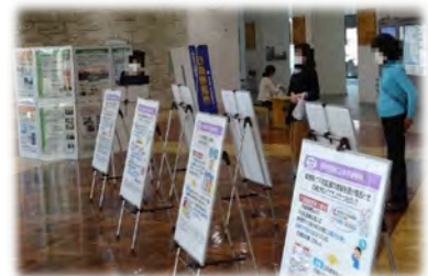
行政相談パネル展（佐賀県佐賀市役所）（R2.10）