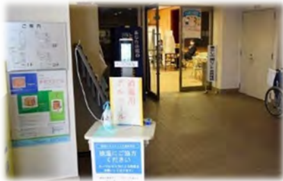
相談所入口にアルコール消毒液を設置して、手指消毒への協力をお願い（京都府城陽市）

相談所においては、感染防止の取組を徹底し、一部の相談所では、テレビ電話等を活用し、直接対面しない方法での相談にも取り組みます。