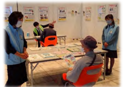
行政相談パネル展（宮城県仙台市せんだいメディアテーク）（R2.10）