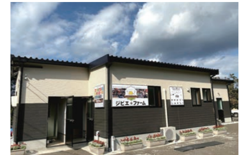
国、市、銀行からの支援により2019年に完成したジビエ☆ファーム。2020年よりジビエの出荷を始めており、地域資源を活かしながら雇用を生み出す好循環なビジネスモデルを展開。