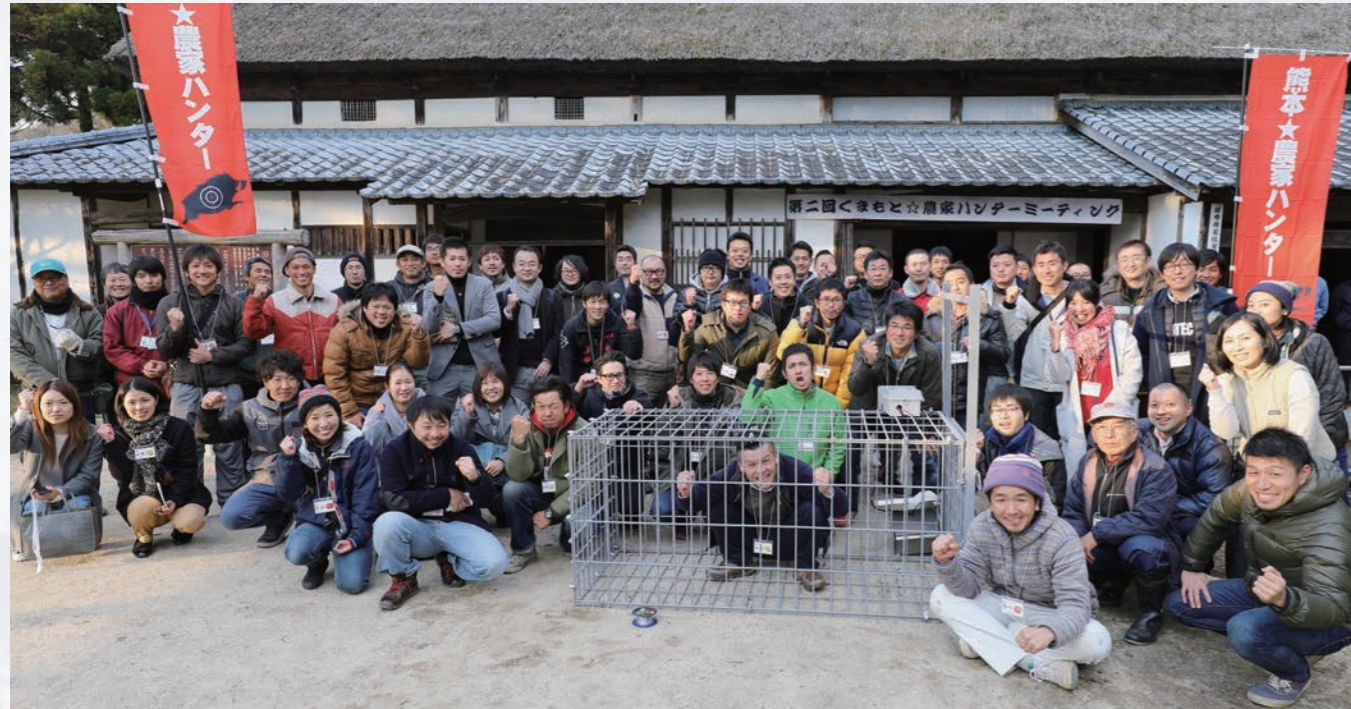
農家ハンター合宿での集合写真。