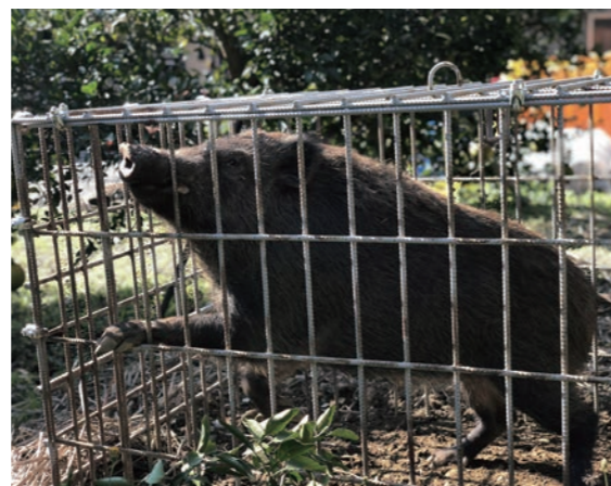
みかん畑に設置した箱罠にかかったイノシシ。捕獲情報はスマートフォンで確認できるため、素早く処理ができる。

さらに、捕獲したイノシシを地域資源として活用すべく、解体加工場「ジビエファーム」において、ジビエとしての出荷をはじめ、ソーシャルビジネスへと発展している。また、熊本県内高校とのジビエ食品開発や、箱罠製作にも取り組んでおり、産学官協働の鳥獣対策が実施されている。