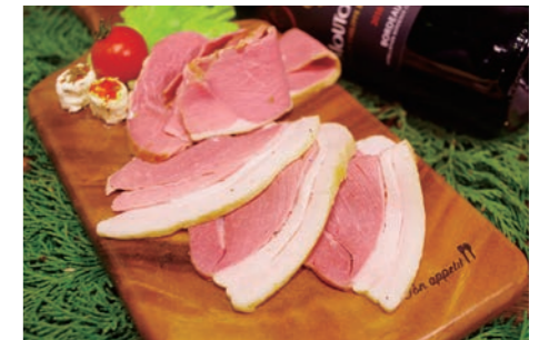
三角地域で捕獲したイノシシのスモークハム。