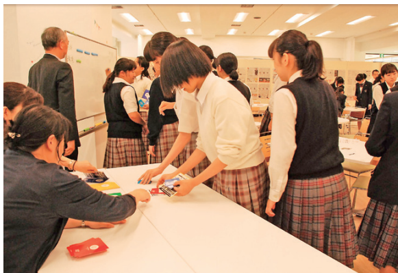
SDGsカードゲームでプロジェクトを実行している様子

エッセイコンテストへの応募をきっかけに、生徒たちは地域社会や世界と自分とのつながりをより具体的に考え、行動の幅を広げており、国際協力に対する積極性を増しているように感じます。