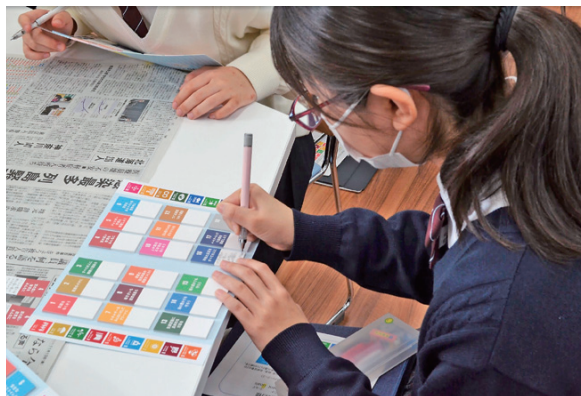
記事に該当すると思うSDGs付箋にコメントを記入