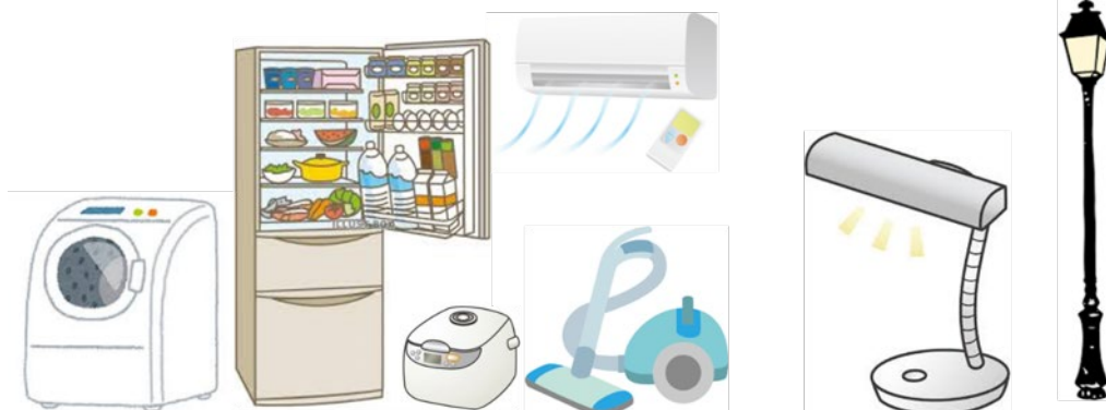
F小委員会（家庭用電気機器・照明機器等の妨害波に関する規格を策定）

F小委員会では、家庭用電気機器、電動工具及び類似の電気機器からの妨害波（エミッション）及び妨害耐性（イミュニティ）並びに照明機器の妨害波に関する許容値及び測定法の国際規格の制定・改定を行っている。F小委員会には、第1作業班（WG1）及び第2作業班（WG2）の2つの作業班が設置されており、WG1は、CISPR 14「電磁両立性—家庭用電気機器、電動工具及び類似機器に対する要求事項」（CISPR 14-1（エミッション）及びCISPR 14-2（イミュニティ））を、WG2は、CISPR 15「電気照明及び類似機器の無線妨害波特性の許容値及び測定法」（エミッションのみ）を担当している。