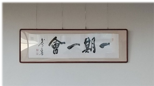
管理棟エントランスの書