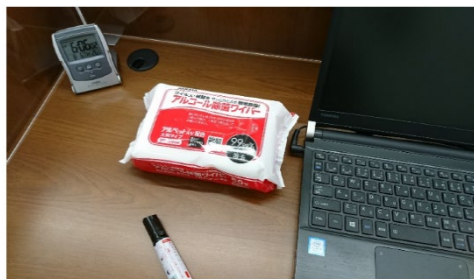
講義ごとにアルコールで除菌