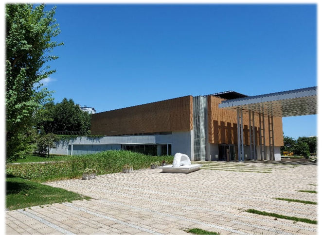
(自治大学校中庭から見た講堂・体育館棟)

注2) 村上義昭：中小企業の事業継承の実態と課題、日本政策金融公庫論集、2017