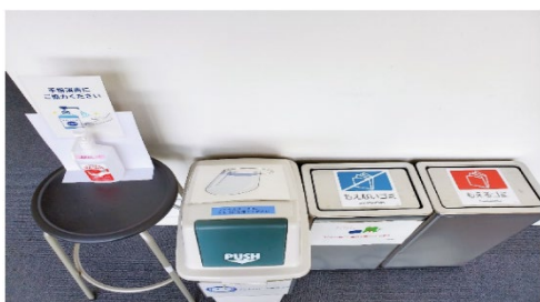
除菌後のゴミは分別