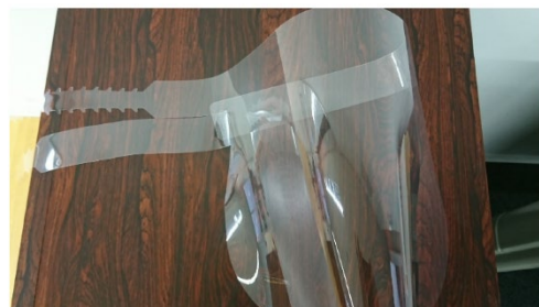
フェイスシールドの配布