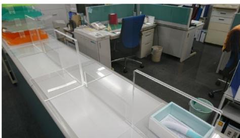
教室外でも接触の削減