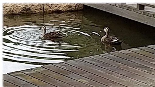
中庭の池も賑やかになりました