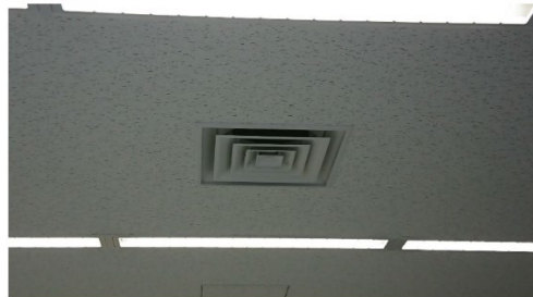
空調による常時外気取り入れ