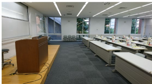
講師と研修生との距離を2m確保