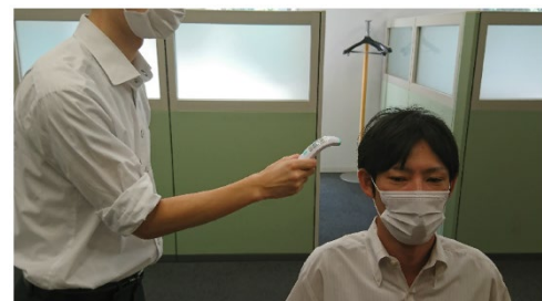
来校者に対する検温の実施