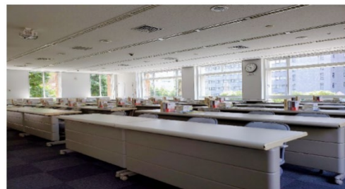
研修生間の距離を確保