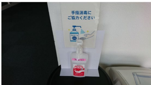
指先アルコール除菌完備