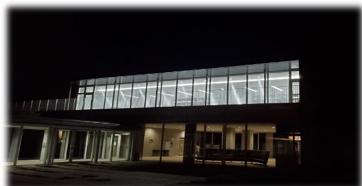
（寄宿舎から見た夜の自主討議室）