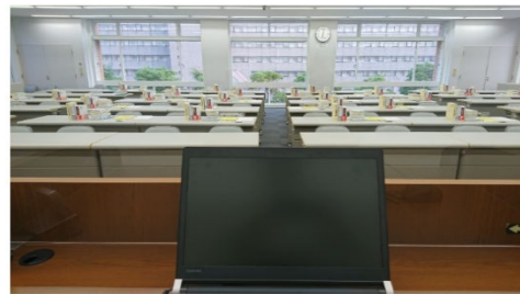
教壇から見た教室