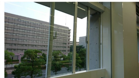
休憩時間ごとに窓からも換気