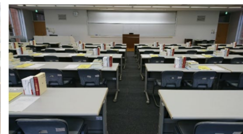
教室後方から見た教壇