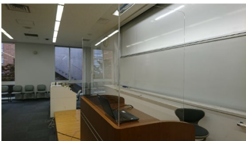
教卓前にアクリル板を設置