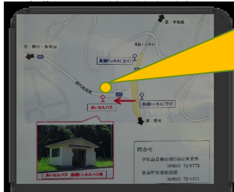
県有地に新たに整備されたバス転回場