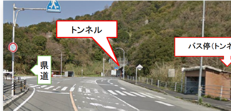
バス停留所からトンネル方向を眺めたところ

行政相談委員が中心となって、安全対策について、地元自治体や関係機関（国、県、警察署、バス会社）との間で協議を重ねました。その結果、バス停を県道側にある町営のバス停に移設し、町が県有地（無償提供）にバス転回場を整備したことで、地元住民が安心してバス停を利用できるようになりました。