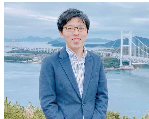
岡山県 県民生活部国際課長