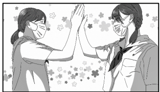
▲筑紫女学園高等学校

将来の有権者となる高校生が呼びかけを行うことで、多くのマスコミにも取り上げられたこともあり、多くの方にご覧いただき、特に同世代である高校生や大学生については、選挙について考えるきっかけになったのではと思います。また、動画の制作に携わった生徒自身の選挙に関する意識の向上にも繋がったと考えています。