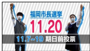
▲福岡工業大学附属城東高等学校