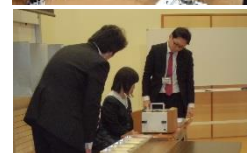
生徒たちに見守られながら、壇上で開票事務を