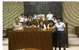
模擬請願 in 宇治市議会

この研修は、自らの学校、明るい選挙の啓発活動、市民の研修、地域おこしの市民をエンパワーする方法論などを参加者は身につけられます。