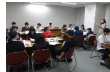
選挙時啓発を振り返るミーティングの様子

今後は、G-Vote18と協力して「選挙をより身近に感じられる」教材作りに取り組む予定です。