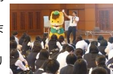
大学での啓発活動の様子