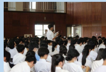
▲会場からの指摘に行政が応答する様子