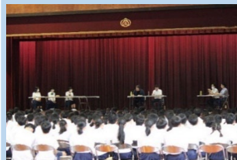
▲シンポジウムの様子

本授業のポイントは2点。第1は本件を単発企画ではなくカリキュラムに位置付け、年間を通じた段階的な探究を仕掛けていること。第2は、それを担当教員だけでなく、学校全体で取り組んでいる点です。学校に根差した主権者教育として多くのことを学ばせて頂きました。