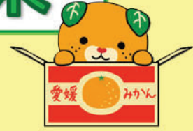
愛媛県イメージアップキャラクター みきやん