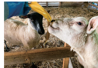
養殖ホソメコンブは畜産肥料としても利用。漁業生産から生態系保全にも配慮した循環型再生産の取組をリアルに実践中。