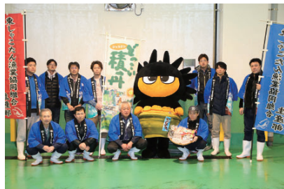
積丹町マスコットキャラクター「うにどん」と一緒に。

これまで廃棄物として扱われてきたウニ殻から新たな価値を創出するなど、地域が一体となって循環型社会の実現に向けて取り組むことにより、過疎地域の持続的発展に寄与している。