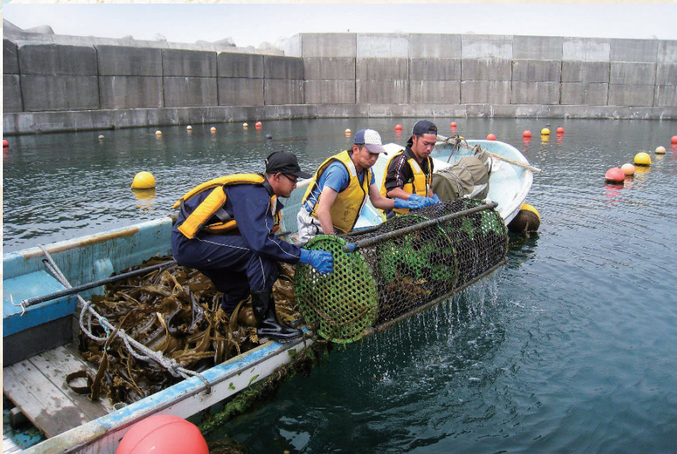
将来まで持続できるウニの生育環境を守り、育てる取組として、海中肥育による生産にも力を入れている。