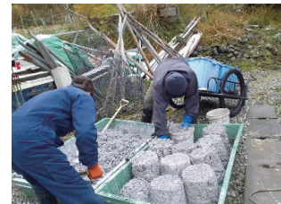
天然コブで成型したウニ殻肥料を自作し試験を実施。経済性や効率性に優れ、何より漁業者自らの手による効果を実感。