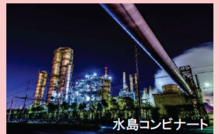
水島コンビナート