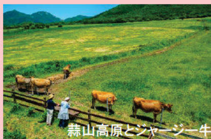
蒜山高原とジャージー牛