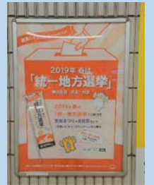
市営地下鉄駅 啓発ポスター

また、市選管では市内の駅にて啓発ポスターの掲出を行うほか、キャンペーンとしては新たに若者が多く集まる駅にてデジタルサイネージ広告を実施し、多くの方に投票の呼びかけを実施しています。