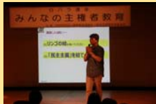
↑林アドバイザーによる講演

大阪府吹田市では、学校教育における主権者教育の充実に加え、地域や家庭において主権者教育の担い手となる市民の関心を高めることを目的として、教員や一般市民を対象とした講座が実施されました。講座の参加者からは、「『子どもを市民にする』というフレーズが強く印象に残った」「民主主義を絵で表そうという試みは難しかったが、面白い取組であると感じた」といった意見が挙げられました。