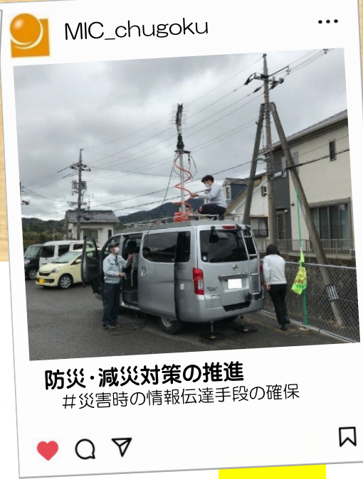
防災・減災対策の推進 #災害時の情報伝達手段の確保