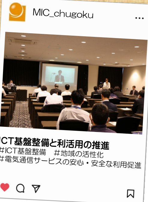
ICT基盤整備と利活用の推進 #ICT基盤整備 #地域の活性化 #電気通信サービスの安心・安全な利用促進