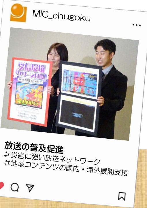
放送の普及促進 #災害に強い放送ネットワーク #地域コンテンツの国内・海外展開支援