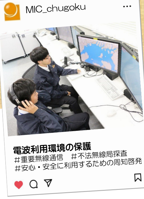
電波利用環境の保護 #重要無線通信 #不法無線局探査 #安心・安全に利用するための周知啓発