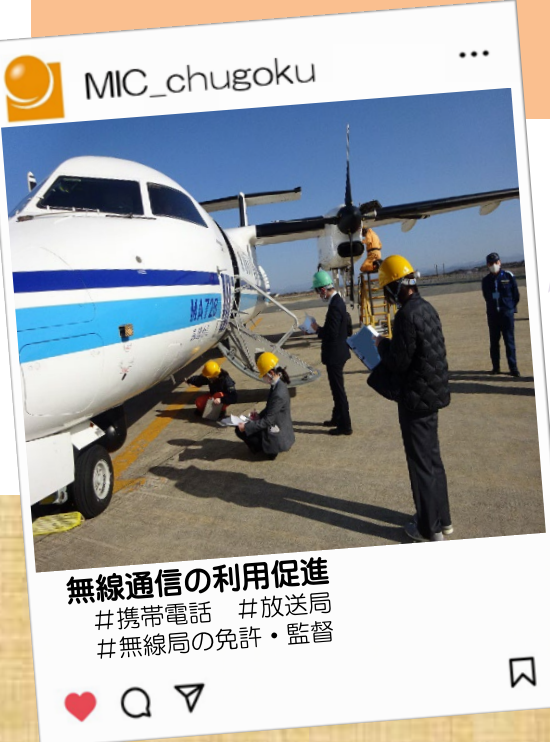
無線通信の利用促進 #携帯電話 #放送局 #無線局の免許・監督