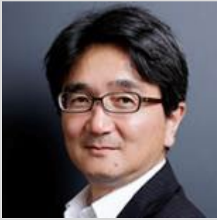
森川博之 東京大学大学院 工学系研究科 教授