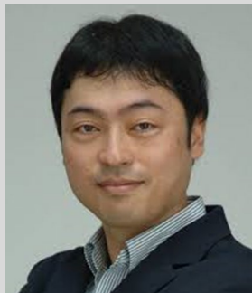
原田博司 京都大学大学院 情報学研究科 教授