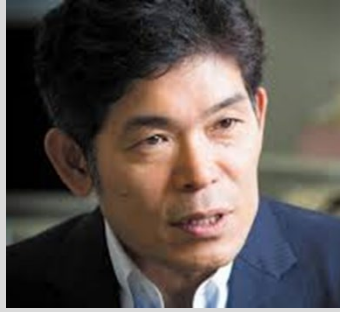
柳川範之 東京大学大学院 経済学研究科 教授