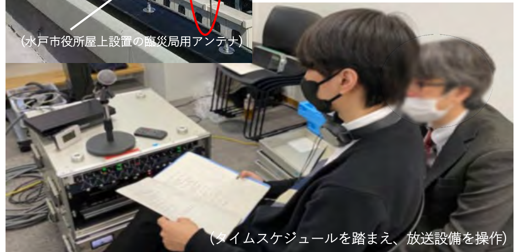
(タイムスケジュールを踏まえ、放送設備を操作)