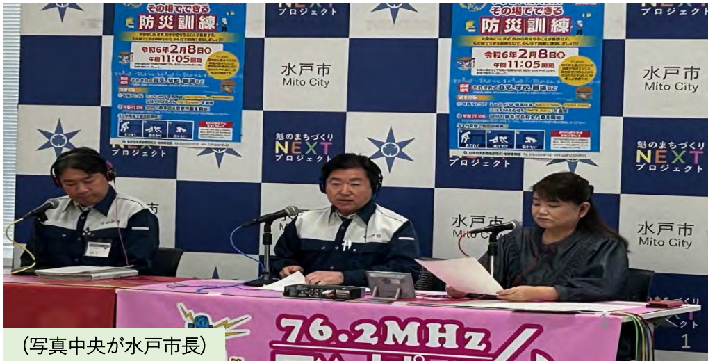
(写真中央が水戸市長)