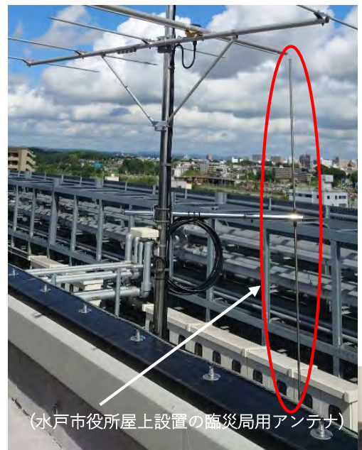
(水戸市役所屋上設置の臨時局用アンテナ)