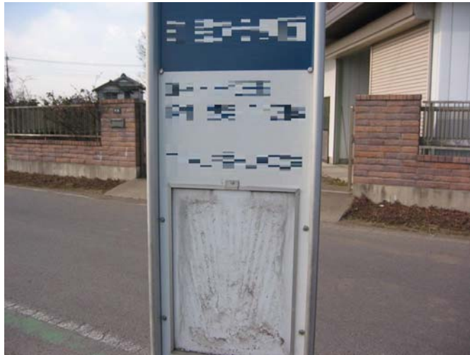
時刻表を掲示していない例