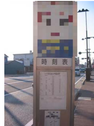
〔参考〕 掲示している例