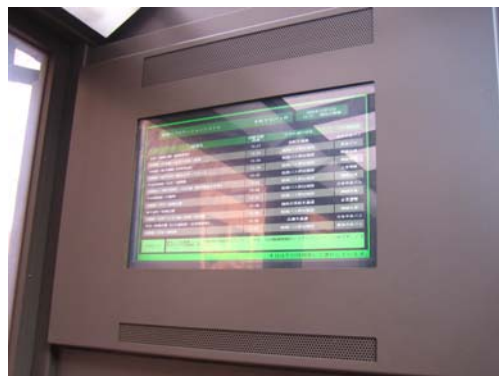
本町バス停の バスケーションシステム 情報板