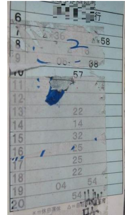
時刻が判読しがたい例