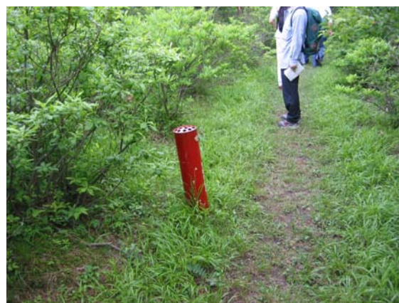
歩道上に吸殻入れが設置されている (八方自然観察教育林)