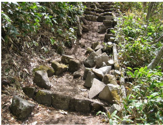
石段が崩壊して歩きにくい状態になっている (切込・刈込湖自然観察教育林)