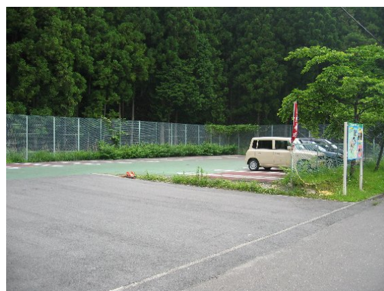
森林スポーツ林の中心となるべきテニスコートが、 駐車場として使用されている (銀山平森林スポーツ林)