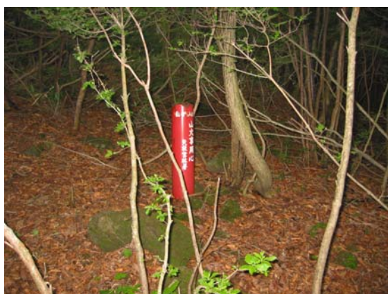
歩道上に吸殻入れが設置されている (八方自然観察教育林)