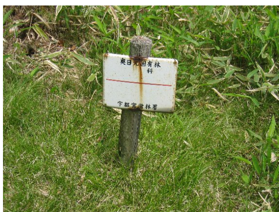
文字が薄れ判読不能となった標識 (平成 19 年末までに処置済) (茶ノ木平自然観察教育林)