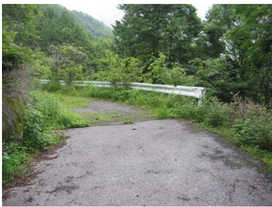
施設計画に記載された遊歩道及び野営場は、実施予定時期から10年以上を経過した現在も設置されていない。野営場への進入路として予定されていたとみられる林道も、一般乗用車の通行は困難な状況。