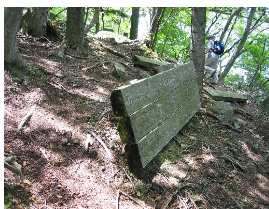
ベンチが倒壊して使用不能になっている (中禅寺湖南岸自然観察教育林)