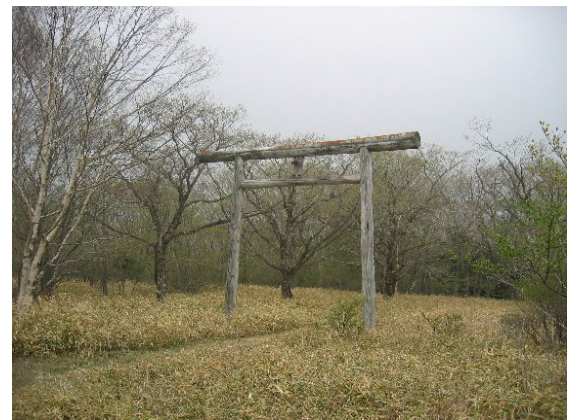
自然観察教育林に指定されているが、遊歩道を含め一切施設が設置されておらず、また施設計画も作成されていない。