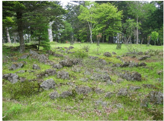
廃止されたロックガーデン。ロープウェイが廃止され入込客が減少した。