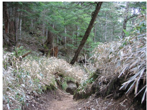
歩道に樹木が倒れかかっている (切込・刈込湖自然観察教育林)