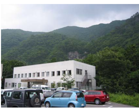
日光市栗山支所から鬼怒川を挟んで対岸が本風致探勝林であるが、同所裏手は急傾斜のため観光客の立入りが事実上不可能。(唐滝風致探勝林)