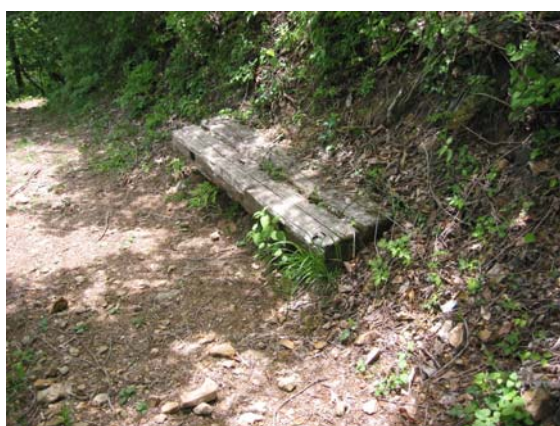
土砂に埋もれて使用不能になっているベンチ (平成 19 年末までに処置済) (鬼怒川風致探勝林)