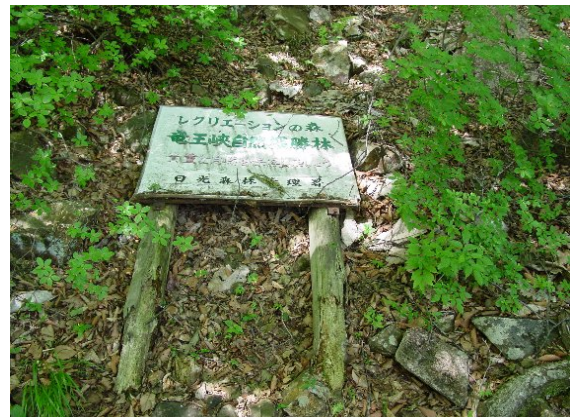
「レクリエーションの森」であることを表示した標識が倒壊している (竜王峡風致探勝林)