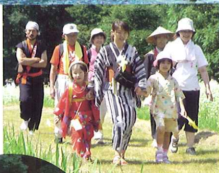
わらじで歩こう七ヶ宿