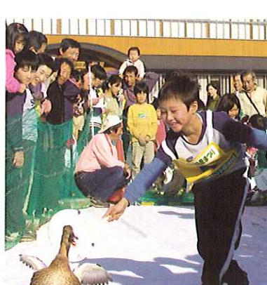
やくらいの里まつり