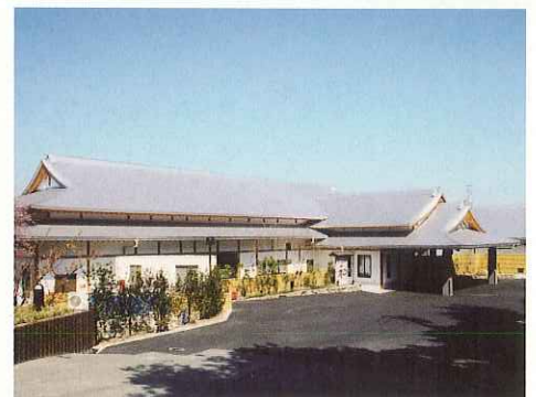
ひこさんホテル 和