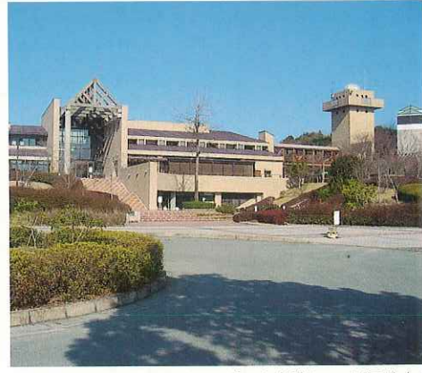
くつろぎの森「グリーンピア八女」