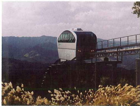
英彦山スロープカー

古より我が国屈指の修験道場として栄えた英彦山。雄大な自然と神秘的な存在感は衰えを知らず、町の観光拠点となっており、平成17年に完成した英彦山スロープカーや花園は、観光客の人気を集め、新たな英彦山観光の核となっています。 四季に彩られ、歴史と文化が薫る町添田町で悠久の歴史に想いを馳せてみませんか。