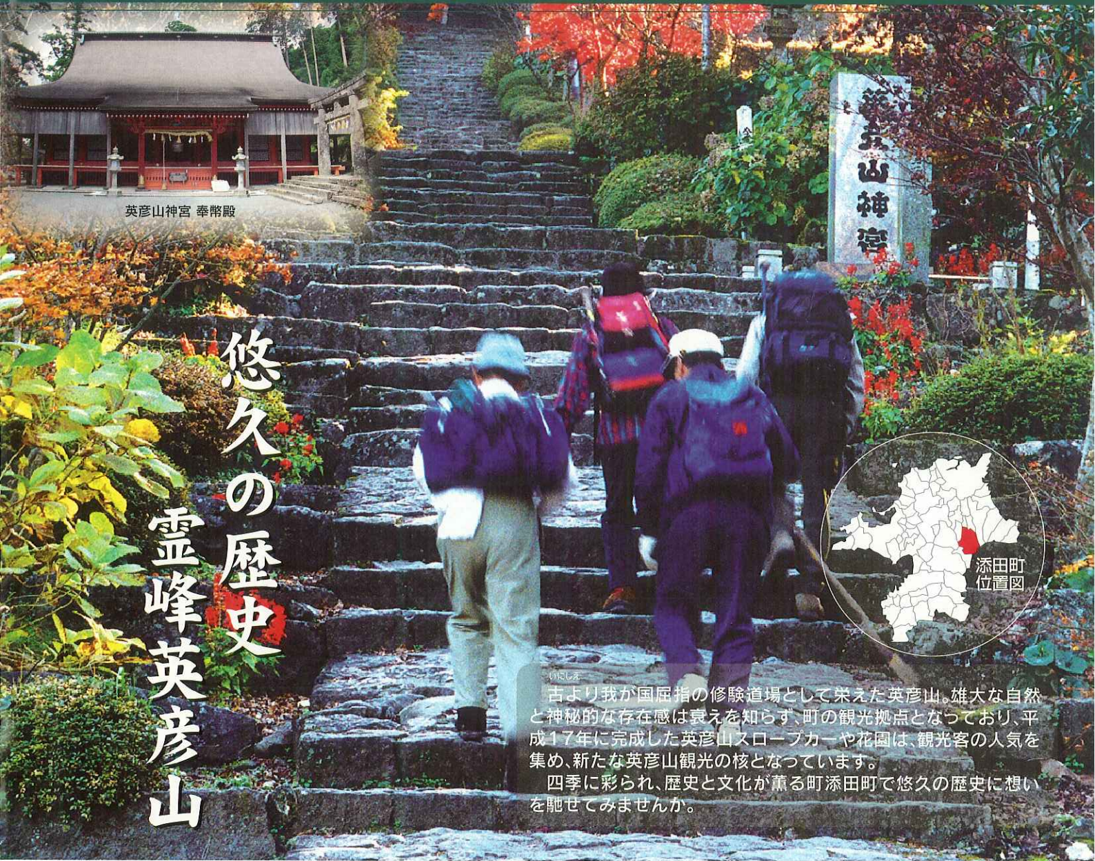
英彦山神宮 奉幣殿