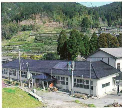
農林業体験交流施設「えがおの森」