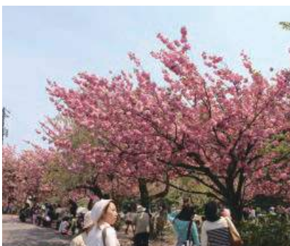
さくら祭りの様子

寄附者に対する事業の成果や進捗状況を報告するため、「船上山さくら祭り」の開催と桜の成長のお知らせを送付しています。