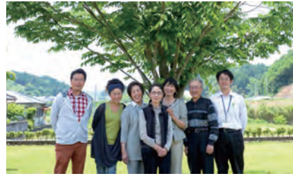
臼杵市内小学校農泊体験学習の受入家庭と関係者の皆さん

大分県の東海岸に位置する臼杵市。豊かな自然と温暖な気候のもと農業や漁業が盛んで、江戸時代から続く醤油・味噌・酒の醸造業、造船業でも栄えています。また、国宝 臼杵石仏をはじめとする文化遺産でも知られています。平成17年に臼杵市と野津町(のつまち)が合併。以来「日本の心が育つまち」を目指して、市民と行政が力を合わせて多様な活動を展開しています。