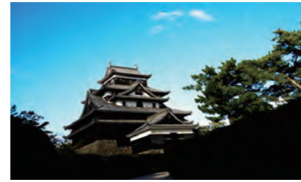
城下町・松江のシンボル松江城

島根県の東部に位置する松江市は、東に中海(なかうみ)、西には宍道湖(しんじこ)と2つの湖を擁する国際文化観光都市です。豊かな自然を背景に古代出雲の中心地として早くから開け、江戸時代には城下町としても栄えました。これら貴重な歴史を守ると同時に、観光資源を活かした新たな魅力づくりにも力を注いでいます。