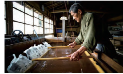
1300年続く伝統技術から生まれてくる手すずきの本美濃紙

岐阜県のほぼ中央に位置する美濃市は、長良川(ながらがわ)をはじめとした美しい自然に恵まれたまちです。江戸時代からの建造物が軒を連ねる「うだつの上がる町並み」や重要無形文化財の本美濃紙(ほんみのし)でも知られています。平成26年に本美濃紙の手漉和紙技術がユネスコ無形文化遺産に登録されたことを受け、平成27年度から新たに「本美濃紙後継者育成のための事業」に取り組むこととしています。