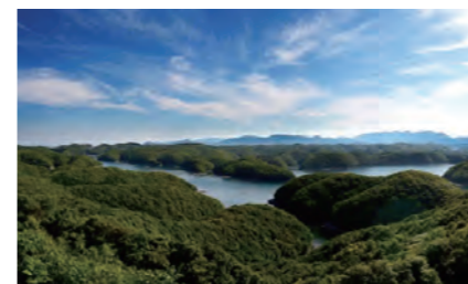
展望台から望む雄大な風景

日本海の西に浮かぶ南北82km・東西18kmの細長い島であり、山林がその面積の89%を占める対馬市。島の地形は標高200m~300mの山々が海岸まで続き、原始林を抱く、勇壮な自然を目にすることができます。国の天然記念物のツシマヤマネコをはじめ、ここでしか見ることのできない動植物が多く生息しています。