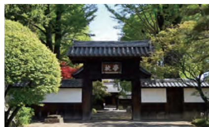
日本遺産である足利学校

東京から北へ約80kmにある栃木県足利市。古くから織物業で栄え、現在は総合的な商工業都市として発展しています。また、日本遺産の足利学校や、鏝阿寺(ばんなじ)をはじめとする足利氏ゆかりの社寺が点在し、豊かな歴史と文化が息づくまちでもあります。これら観光資源を活用して映画やドラマのロケ地誘致を行うなど、新たな魅力づくりにも力を注いでいます。