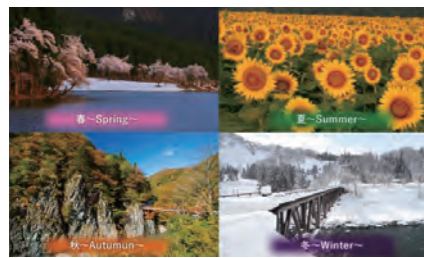
津南町の春夏秋冬

津南町は、新潟県南部に位置し、日本一雄大な河岸段丘(かがんだんきゅう)上に田畑や森林が大きく広がり、信濃川が運ぶ心地よい風を浴びながらゆったりと流れる景色が、いつの時代も私たちの心を和ませてくれます。ときには厳しい豪雪の中で闘うこともありますが、わが町の先人たちは数千年の歴史のなかで文化を築き、農を営み続けてきました。