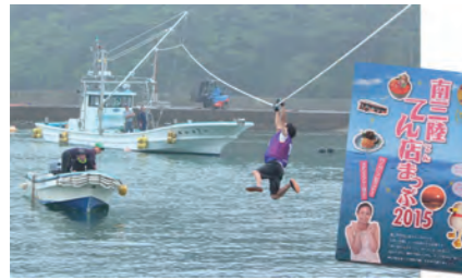
海の運動会など、おらほのまちづくり補助金を活用した取組

志津川町(しづがわちょう)と歌津町(うたつちょう)が合併して10年一宮城県の北東部に位置し、リアス式海岸の豊かな景色に恵まれた、南三陸町。平成23年3月11日、東日本大震災により甚大な被害を受けた町は、今も全力で復興に取り組んでいます。古より海や山とともに生き、人と人とのつながりの大切さを熟知した先人たちが、協働し継承してきたまちづくりの想いは、様々な事業の中に息づいています。