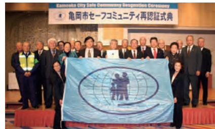
2013年2月、セーフコミュニティの再認証を取得

古来、京の都に隣接する要衝の地として、歴史的にも文化的にも大きな役割を果たしてきた亀岡市は、豊かな自然環境と都市的な利便性が調和する住みよいまちです。2008年3月には日本で初めてWHOセーフコミュニティ協働センターが推奨する「セーフコミュニティ」の認証を取得するなど、「安全・安心こそ最大の福祉」を理念に、「日本一しあわせを実感できるまち」を目指しています。