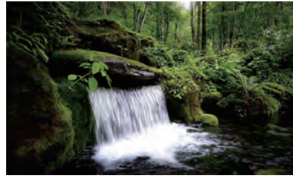
大雪山旭岳から湧き出る湧水

北海道のほぼ中央、旭川の中心部から13kmの場所にある東川町は、大雪山(だいせつざん)国立公園のふもとに広がるまちです。大雪山連峰の最高峰・旭岳(あさひだけ)に降った雪や雨が長い年月をかけ大地にしみこんだ地下水を全戸で使用しており、道内で唯一、上水道のないまちとして知られています。恵まれた自然環境と旭川空港に近い利便性の高さ、そして「写真の町」を掲げての写真にまつわるイベントの開催で観光客を集めています。