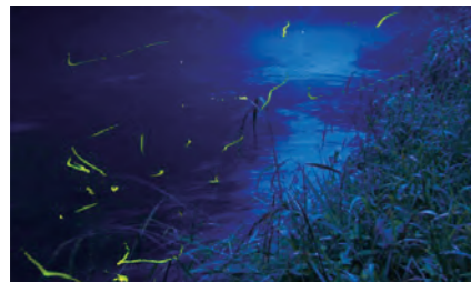
入間川上流で見ることができる、蛍が舞いぶ様子

飯能市は、都心から電車で一時間ほどで辿り着く都会に最も近い里地里山の地方都市です。昔から林業が盛んで、森林と共に暮らす生活が残っています。人口約8万人、面積にして193.05km 2 と人口に対して広い面積の市です。76%が森林です。おのずと空気、水、日差しが違います。飯能市では、森林や森林の恵みを享受する生活を守っています。