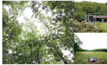
ふるさと納税を活用して森づくり作業が進む知床国立公園内の100平方メートル運動地

北海道の東部、オホーツク海に面した斜里町は、100kmを超える海岸線と雄大な知床連山を擁するまちです。ユネスコの世界自然遺産に登録されている知床半島でもよく知られています。知床半島の周辺海域は、北半球において流水が接岸する最南端。流水がもたらす生態系、そして海域と陸域が一体となった独特の環境のもと、多様な動植物が息えています。斜里町ではこの貴重な自然を守るために、長年にわたり地道な活動を続けています。