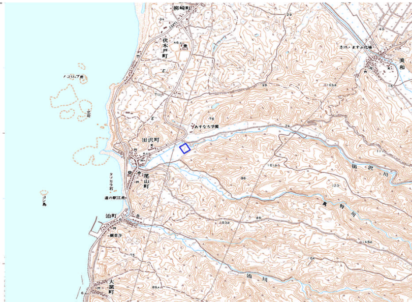
この地図は、国土地理院長の承認を得て、同院発行の数値地図25000（地図画像）を複製したものである。（承認番号 平22業複、第109号）