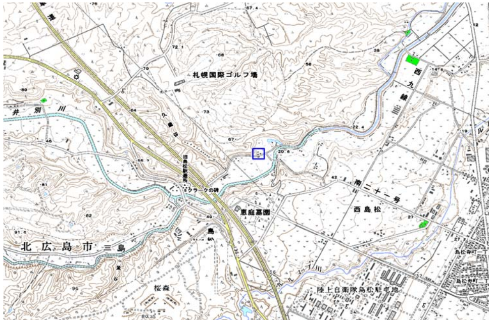
この地図は、国土地理院長の承認を得て、同院発行の数値地図25000（地図画像）を複製したものである。（承認番号 平22業複、第109号） 枠内：難視範囲