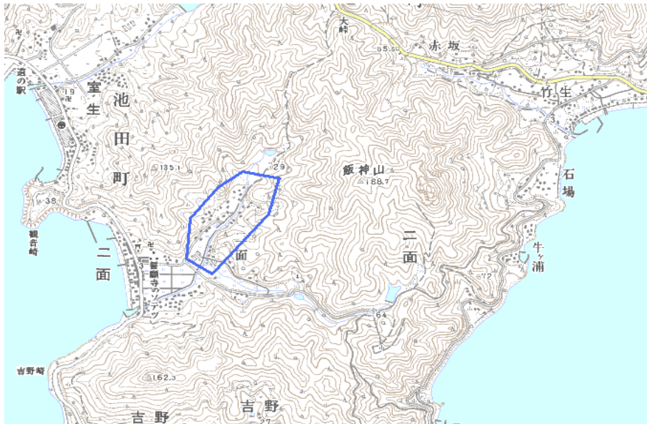
この地図は、国土地理院長の承認を得て、同院発行の数値地図25000（地図画像）を複製したものである。（承認番号 平22業複、第109号）