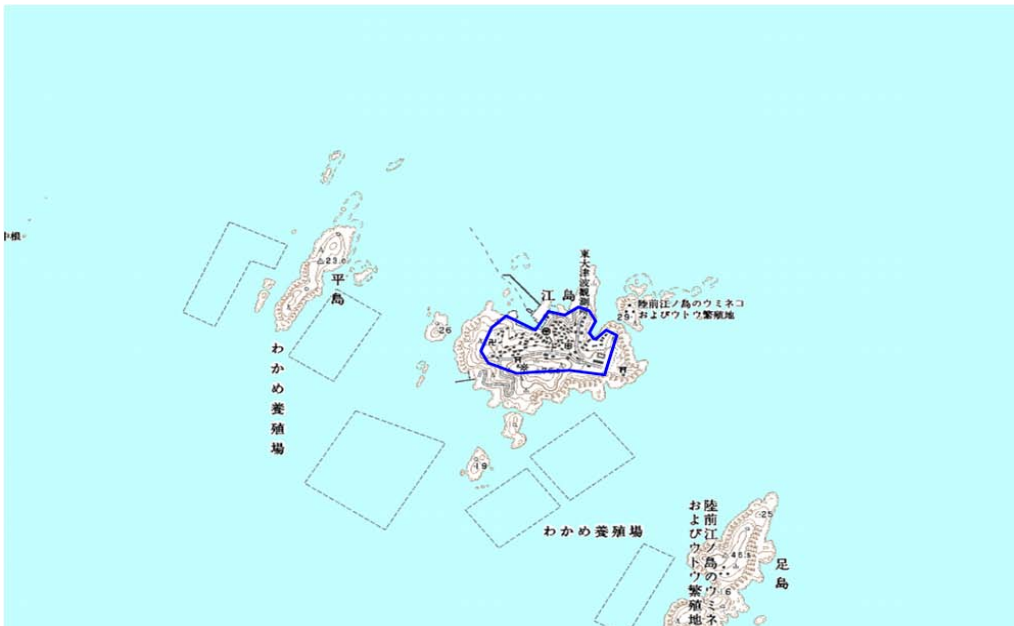
この地図は、国土地理院長の承認を得て、同院発行の数値地図25000（地図画像）を複製したものである。（承認番号 平22業複、第109号）