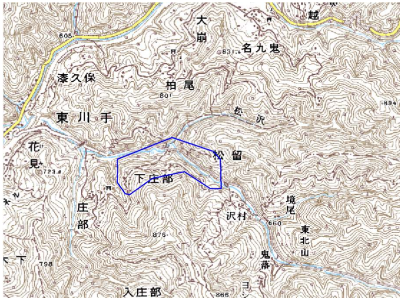
この地図は、国土地理院長の承認を得て、同院発行の数値地図25000(地図画像)を複製したものである。(承認番号 平22業複、第109号)