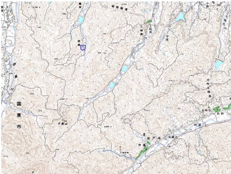
この地図は、国土地理院長の承認を得て、同院発行の数値地図25000（地図画像）を複製したものである。（承認番号 平22業複、第109号）