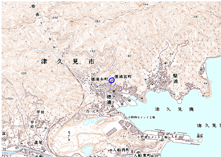
この地図は、国土地理院長の承認を得て、同院発行の数値地図25000（地図画像）を複製したものである。（承認番号 平22業複、第109号）