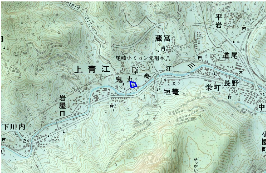
この地図は、国土地理院長の承認を得て、同院発行の数値地図25000（地図画像）を複製したものである。（承認番号 平22業複、第109号）