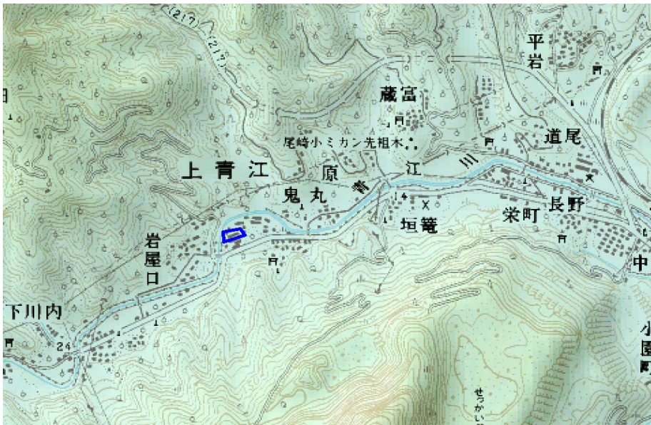
この地図は、国土地理院長の承認を得て、同院発行の数値地図25000（地図画像）を複製したものである。（承認番号 平22業複、第109号）